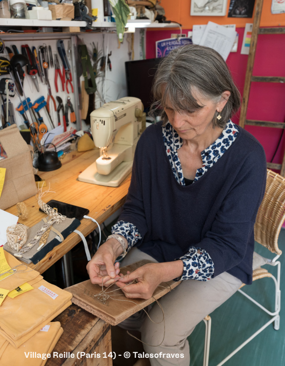
Village Reille (Paris 14)