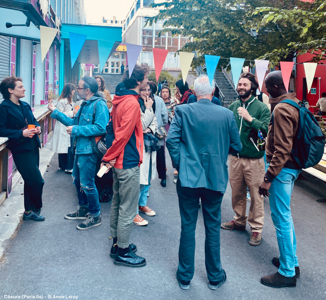
Césure (Paris 5e)