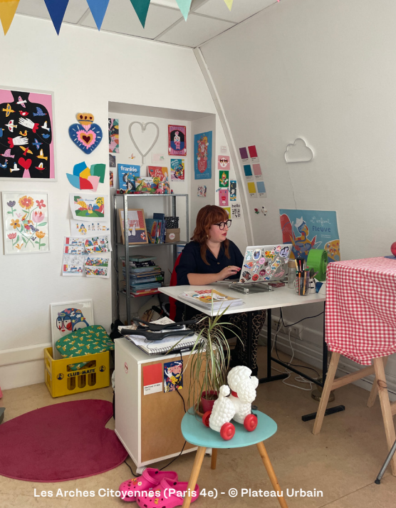
Les Arches Citoyennes (Paris 4e)