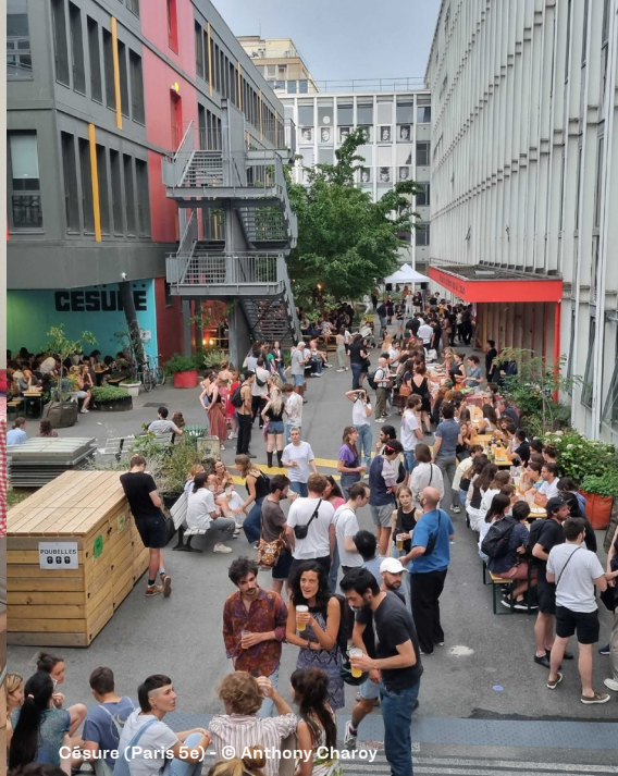
Césure (Paris 5e)