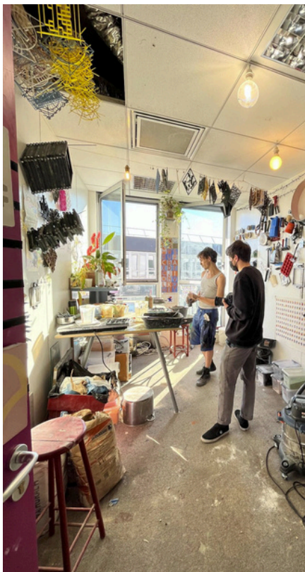
ATELIER DE CRÉATION, OPALE, MONTREUIL