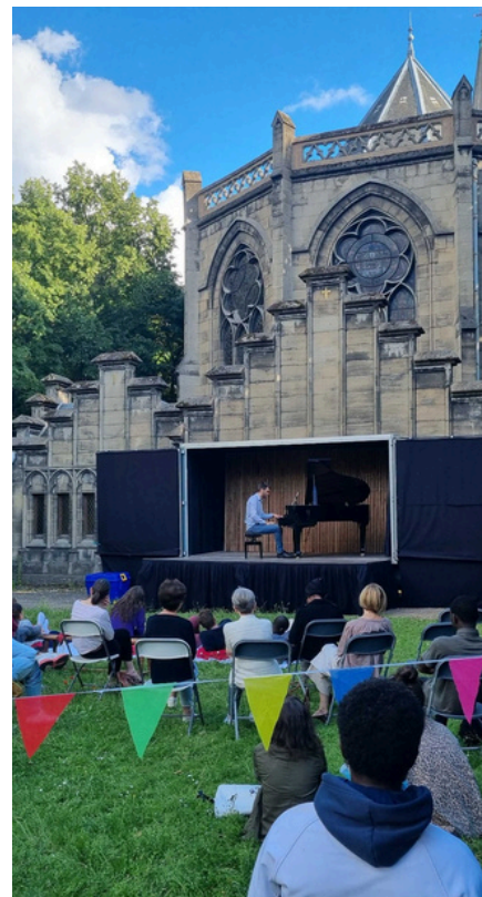
VILLAGE REILLE, PARIS